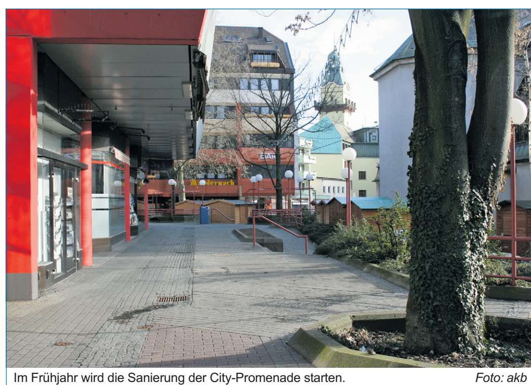
Im Frühjahr wird die Sanierung der City-Promenade starten.

Promenade. „Die Installation eines Geschäftswegweisers wäre eine notwendige, aber sinnvolle Zugabe für den Geschäftsstandort Völklingen“, so die Geschäftsbetreiber. Die Geschäftsleute des Völklinger Innenstadtdreiecks haben vor allem die gute Erreichbarkeit der Geschäfte für ihre Kunden thematisiert, die während der bevorstehenden Bauphase gewährleistet sein muss. Den demografischen Wandel vor Augen wollen sie diese aber auch langfristig durch die bauliche Gestaltung der neuen Promenade gewahrt sehen. Innerhalb des sogenannten Citydreiecks zwischen Rathausstraße, Bismarckstraße und Poststraße sind mit den bereits ausgebauten Teilbereichen Pfarrgarten, Adolph-Kolping-Platz, östlicher Bereich Forbacher Passage und südlicher Bereich City-Promenade wesentliche Teile der Fußgängerzone aufgewertet worden. Mit einem weiteren Bauabschnitt soll nun die Lücke der Fußgängerzone zwischen Bismarckstraße, Adolph-Kolping-Platz bis zum Tiefgaragenaufzug geschlossen werden. Wesentliche Korrekturen sind die Wegnahme der vorhandenen Mauern und Hochbeete und das Entfernen eines Teils der zu eng stehenden Platanen. Die Mauern zwischen den beiden höhenversetzten Ebenen werden durch Stufen analog zum südlichen Teil der Citypromenade