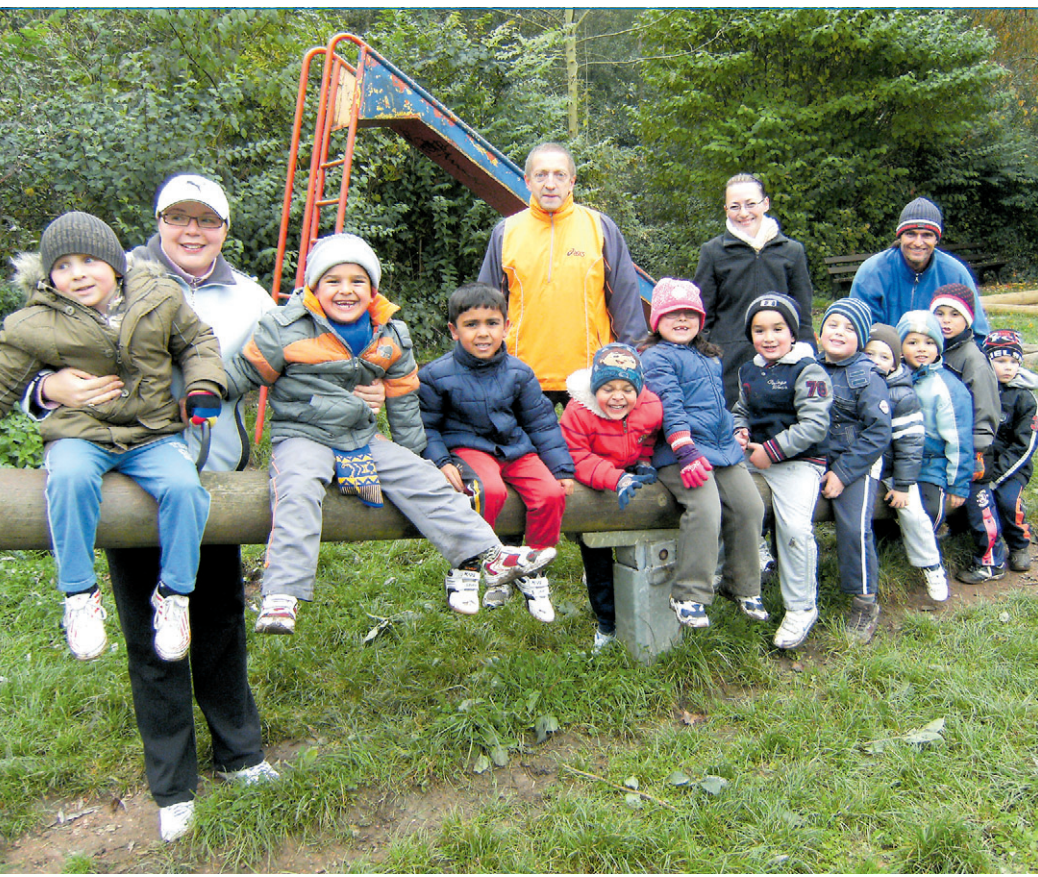
Die Laufgruppe mit ihren professionellen Trainern und Betreuerinnen

Infos über das gesamte Angebot und Anmeldungen bei VHS-Sekretariat: Telefon (0 68 98) 13-25 97. Online-Anmeldungen unter: www.vhs-voelklingen.de